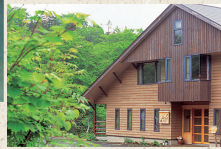
八甲田の山懐に抱かれた宿