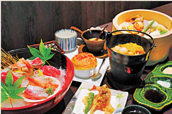
夕食は青森の旬の食材を使った会席料理を