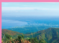
山頂からは北海道や八甲田連峰まで見渡せる

④野辺地町地続山国有林内 ⑤青い森鉄道野辺地駅から車で20分 ⑥散策自由 ⑦30台