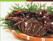
カニの濃厚な旨味が味わえるガニ汁