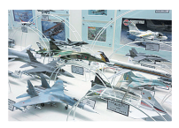
歴代の航空機や戦闘機の模型も展示している