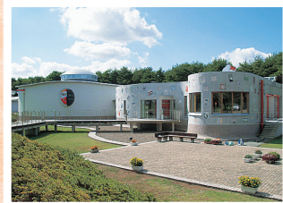
寺山修司の活動を迎えることができる貴重なスポット

少年時代を三沢で過ごした詩人・寺山修司の世界が分かる記念館。④三沢市三沢淋代平116-2955 ☎バス停寺山修司記念館からすぐ④入館530円(企画展込み) ⑤9～17時 ⑥月曜(祝日の場合は翌日、要問合せ) ⑦70台