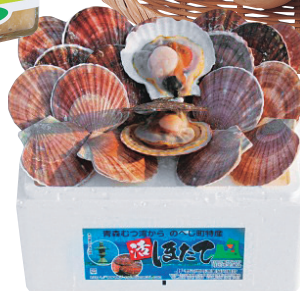
活ホタテは大粒で口あたりがまろやか