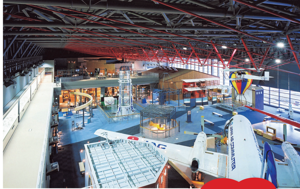
青森県立三沢航空科学館では国産機「YS-11」も展示されている

東は太平洋、西は小川原湖に面し、豊かな自然に恵まれたエリア。米軍三沢基地があることから、米軍人の生活の拠点でもあり、異国情緒あふれる街並みも魅力の一つ。個性的なご当地グルメも豊富。