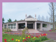
小川原湖の歴史や自然について学べる

①東北町上野上野191番地30 ②青い森鉄道北上町駅から徒歩15分 ③入館200円 ④9～16時 ⑤火曜、祝日 ⑥100台