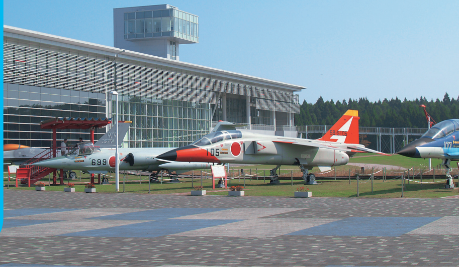
屋外は三沢大空ひろばとして整備されている