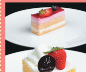
ショーケースに並ぶショートケーキ380円などはテイクアウトもできる

④六ヶ所村尾駱野附1302-5 ⑤青い森鉄道野辺地駅から車で30分 ⑥11～22時 ⑦日曜 ⑧15台