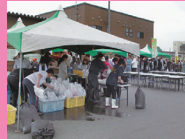
野辺地町の味を一堂に集めた朝市

④野辺地町野辺地568 ⑤青い森鉄道野辺地駅から車で8分 ⑥8時~9時30分 ⑦周辺利用