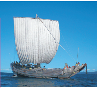
復元北前型舟才船「みちのく丸」は展覧航行できる国内唯一の大型木造船。2008年NHK大河ドラマ『篤姫』に登場しており、2016年冬以降公開予定の人気グループEXILEのHIROプロデュースの映画『たたら侍』に登場する