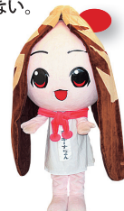
ホッキーナちゃん