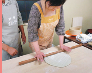
愛好会のスタッフが丁寧に教えてくれる

④スバハウスろっかほっか→P5参照 ⑤1人3000円(10～30名で10日前までに要予約)