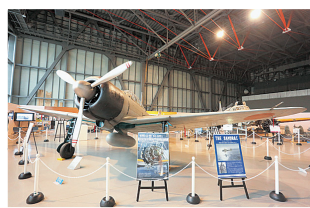
企画展示室では零戦 52 型の模型も間近で見られる

アメリカからの輸入食品や雑貨、ミリタリーグッズなどを取り扱う複合施設。特大サイズの菓子など、アメリカンな品揃えが魅力的。④三沢市中央町2-8-34 ☎バス停アメリカ広場からすぐ④10～21時 ⑥無休 ⑦100台