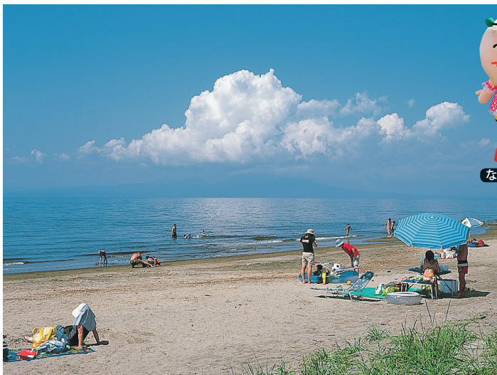
広々とした砂浜で快適に過ごせる