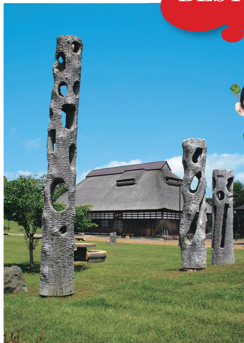
江戸時代後期ごろに建てられた古い茅葺家屋を移築したもの