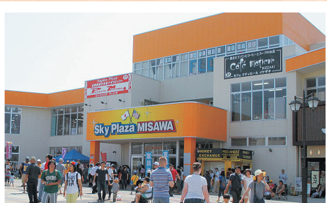
米軍基地に隣接し外国人の姿も多く見られる