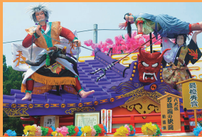
京都祇園祭を思わせる豪華絢爛な山車