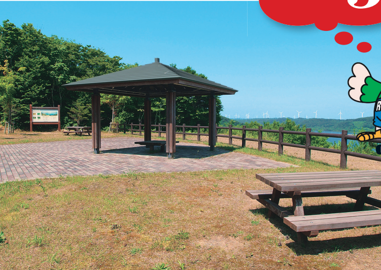
東屋やベンチなども整備された高台の公園