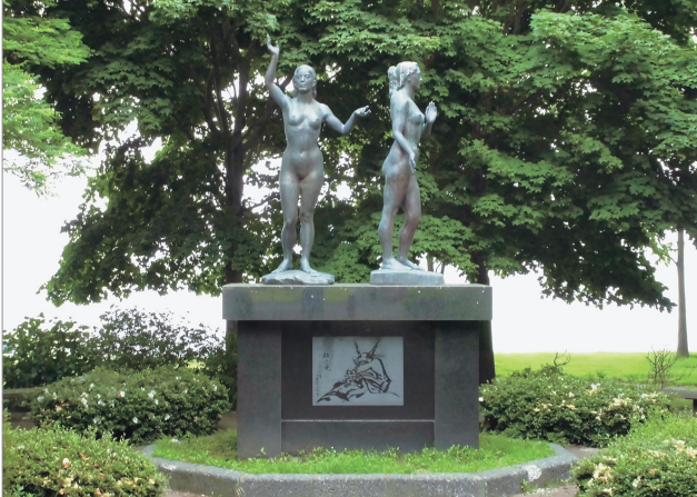
小川原湖のほとりには玉代姫と勝世姫の像が立つ

上十三地方のほぼ中央に位置する東北町。町内には縄文時代以降の遺跡が多数点在し、豊かな自然と史跡を楽しめる。小川原湖の特産品を使ったグルメと、天然温泉も魅力。