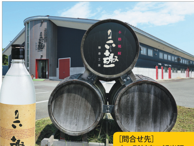
太陽光発電システムも導入している

「エネルギーパーク」と称され、さまざまなエネルギー関連施設が点在する。太平洋に面した一帯は湖沼が多く、昔ながらの素朴な風景も魅力。旬の魚介を使ったグルメも名物。