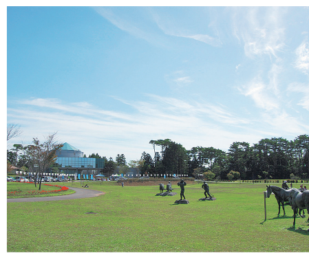
さまざまな施設を備えた人気スポット

整備された丘陵地に、道の駅、先人記念館、くれ馬ば～くを備えた観光スポット。ゴーカートなども楽しめる。④三沢市谷地頭4-298-652 ☎バス停斗南藩記念観光村からすぐ④9～17時(11～3月は～16時) ⑥無休 ⑦134台