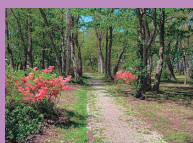
湖畔の自然を観察しながら散策しよう