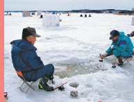
防寒対策をしっかりして出かけよう