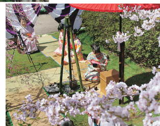
4月下旬～5月上旬に東北町桜まつりが開催される