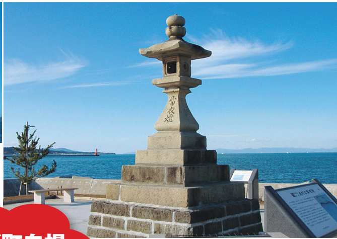
野辺地湊跡にあり往時の面影を伝えている

江戸時代には港町として栄え、多くの北前船で賑わった。歴史を物語る常夜燈が見られるほか、当時伝えられた「かわらけつめい茶」など食文化にも歴史をうかがえる。