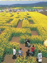
菜の花開花中には入場できる菜の花大迷路100円