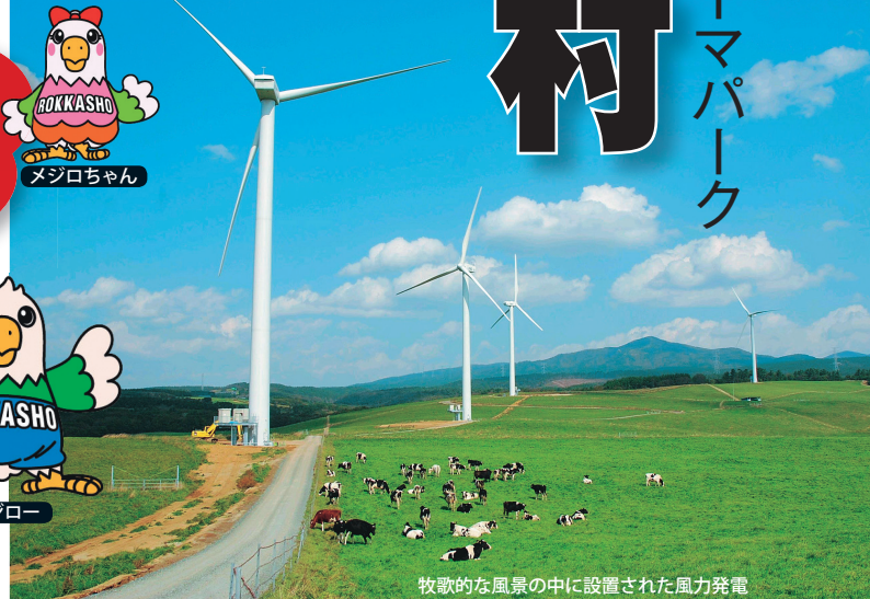
牧歌的な風景の中に設置された風力発電