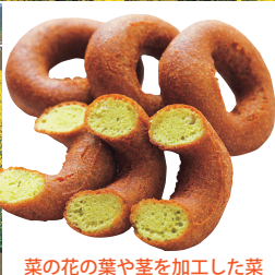
菜の花の葉や茎を加工した菜の花ドーナツ 1個 70円