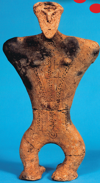
高さ32cm、国指定の重要文化財