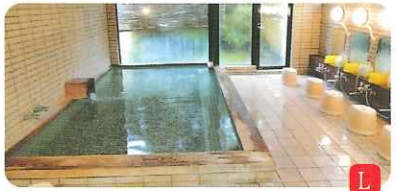
十和田湖振山亭 电话0176-75-2711 11:30~21:00/ 大人500日元、小学生300日元、学龄前儿童200日元