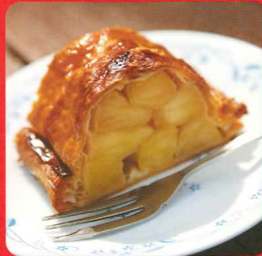
充满爱意的纯手工苹果派

纯手工精心烤制的酒店自制苹果派。 店名 十和田湖MarineBlue 联系方式 电话0176-75-3025 时间 8:00-18:00 定期休息日 冬季停业 (11月中旬~4月中旬)