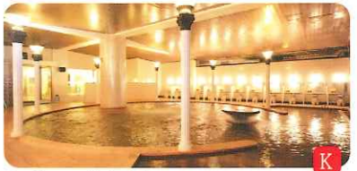
十和田荘酒店 电话0176-75-2221 15:00~21:00/大人500日元、儿童300日元

休屋有可以顺路泡温泉的景点，如果在能量景点巡游过程中感到疲劳，不妨泡泡温泉，养精蓄锐。