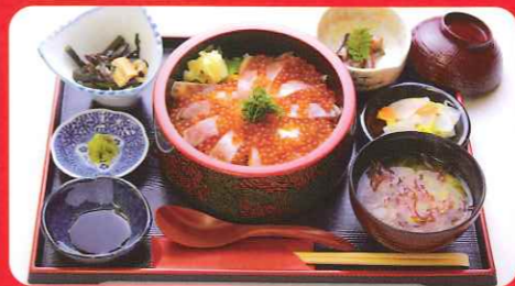
推荐红鲟料理 开运红鲟亲子饭

对万物心怀感恩，愉快享用美食。品尝应季美食与当地美食，让身心充满能量。若论当地美食……生长在十和田湖的天然鱼“十和田湖红鲟”作为十和田品牌备受瞩目。