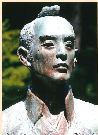
新渡戸 十次郎 (太素塚・新渡戸十次郎像)

三本木開拓の祖盛岡藩士の新渡戸傳は、安政2年(1855)に稲生川の工事に着手、鞍出山と天狗山に2本の穴堰を掘削し、4年の歳月をかけて安政6年(1859)に稲生川の上水に成功しました。