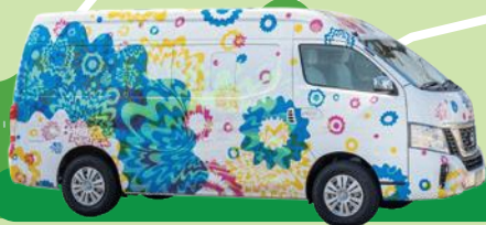
西地区シャトルバス運行車両