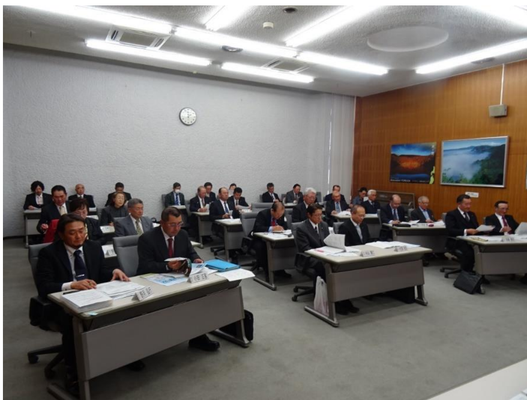
農業委員会総会（市役所議会会議室）平成30年4月18日