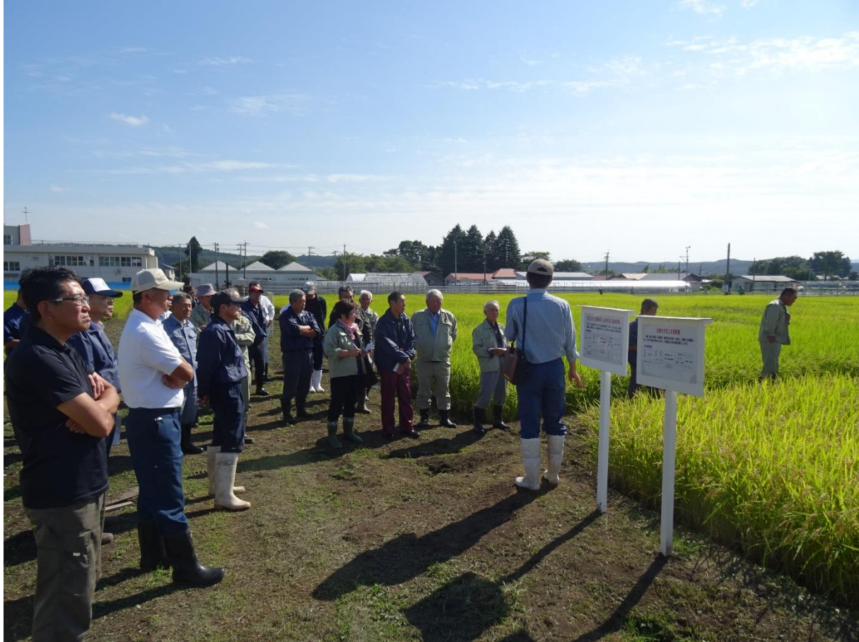
水稻作柄状況調査（青森県産業技術センター 農林総合研究所 藤坂稲作部）の様子 （平成30年9月12日）