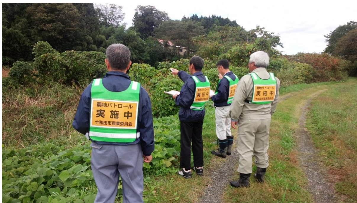
農地パトロールの様子 平成 30 年 10 月 18 日