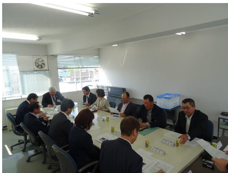
十和田市農業者年金推進協議会定例総会 平成30年5月24日(市役所第1委員会室)