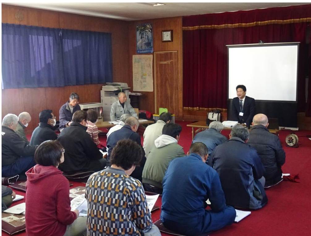
移動農業委員会（下洗生活改善センター） 平成31年1月27日