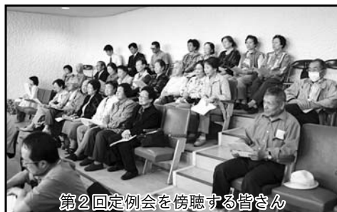
第2回定例会を傍聴する皆さん