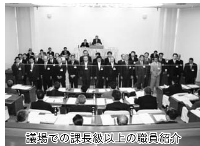
※竣工期限 平成二十年三月二十日