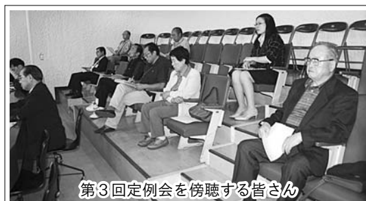
第3回定例会を傍聴する皆さん