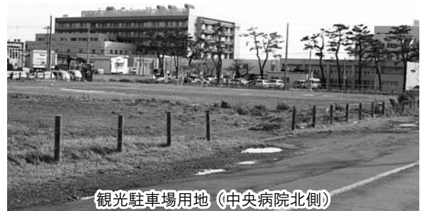
観光駐車場用地（中央病院北側）