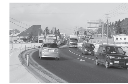
国道45号を補完する路線の新設を(折茂地区)

議員 子供たちに十 和田湖や奥入瀬を知って もらうための、郷土学習 充実事業の効果は。