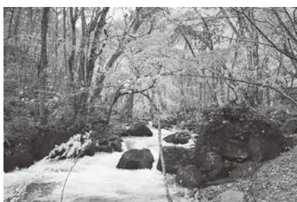
世界水準のナショナルパークを目指して

議員 道路管理につ いて、千葉県柏市ではパ トロール車にスマートフォ ンを取り付け、内蔵され た加速度センサーで舗装