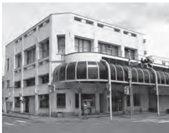
みちのく銀行旧稲生町支店

みちのく銀行旧稲生町支店跡地の有効活用 市民の声に応えた活用を訴えました。 ↓跡地に多目的施設の（仮称）地域交流センターが整備されます。