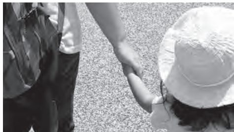
痛ましい虐待事件のない社会を

警察等の行政機関や保育施設等の関係機関で構成する市要保護児童対策協議会で連携して虐待の未然防止に取り