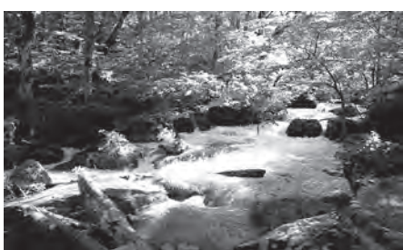
恵まれた自然環境を保全しつつ魅力発信を

きつける取り組みを集中的に実施していることから、観光振興を目的に世界自然遺産への登録を目指す考えはありません。