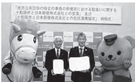
地域に密着した郵便局との連携