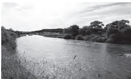
雑木の協働伐採で良好な河川環境保全を