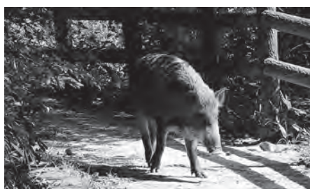
豚コレラ発生前に早期の対策・対応を