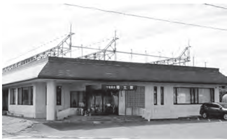
郷土館～郷土史研究の殿堂～