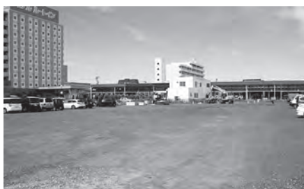
バスターミナル整備予定の旧亀屋跡地付近