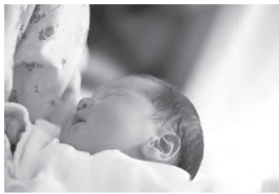
子育て支援の充実を

質問 2020年度に耐震改修のため休館となる市民文化センターの代替施設(コミュニティセンターやトワレ等)では、予約可能時期が3か月前からとなっている。不便なので、市民文化センターと同様に1年前からにしてほしい。