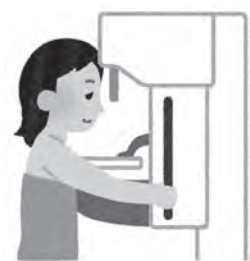
乳がんは早期発見が重要