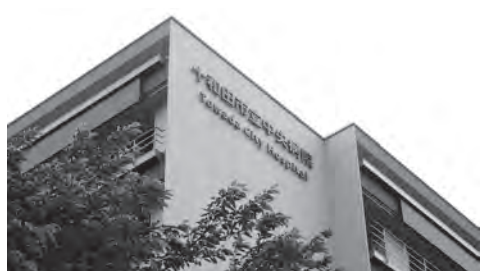
持続可能な経営を現実のものに

三地域における地域完結型の医療に貢献するとともに、病棟開設による収益性の向上と、医療介護連携による在宅医療を進めていく将来的な展望も踏まえ、今後も必要性は極めて高いと考えています。