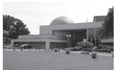
休館予定の市民文化センター