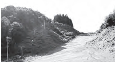
活用が期待されるスキー場

農林部長 昨年に活動組織向けの説明会を開き、活動組織の要望を取りまとめた上で、県に要望を上げています。