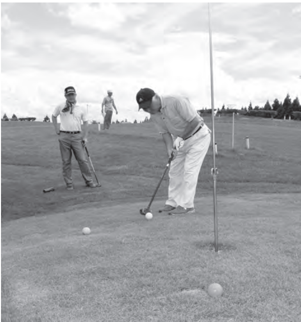
2つのパークゴルフ場が利用しやすくなります

A 現在の両パークゴルフ場のシーズン券の料金を合算し、その8割に設定しました。料金軽減により利用者数の増加を図ります。