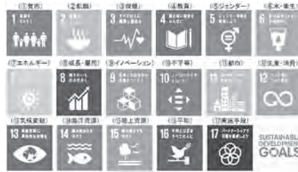
SDGsで豊かで活力ある社会を

議員 「誰一人取り残さない」との理念を掲げ国連で採択されたSDGs（持続可能な開発目標）では、2030年までに達成する17の目標が示された。当市の取り組みがどの目標に当たるのかをアピールする考えは。 企画財政部長 国や県と連携した広報活動等基本に、ホームページ等を活用してわかりやすく情報発信したいと考えています。 議員 SDGsを子供たちにどう教育していくか。