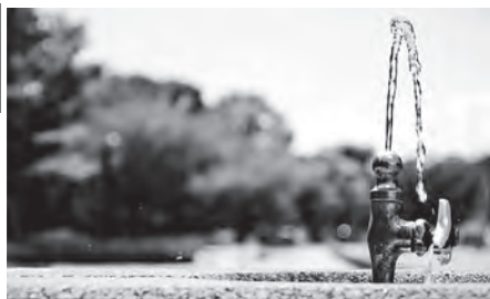
安全で安心な水の確保を

民生部長 市民ニーズを把握する上で有効な手段と考えますので、検討したいと考えています。