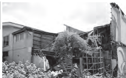
空き家を整理し地域の魅力向上を