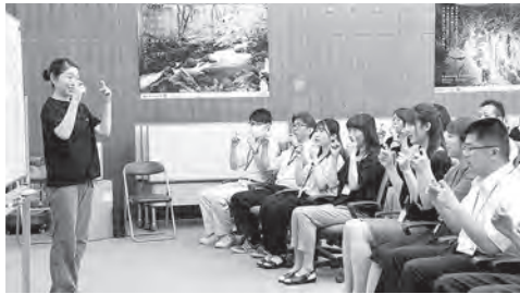
手話を使った接遇研修

副市長 新庁舎での業務開始を機に、窓口担当職員を対象に、生活福祉課の手話通訳者による勉強会を開き、早期に対応したいと考えています。