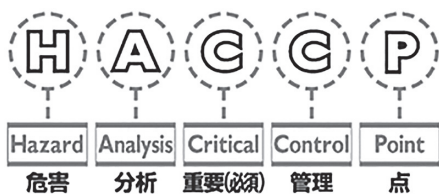
HACCPの柔軟な指導と丁寧な普及推進を

（ハサップ）は、2021年に義務化が予定されている国際的に認められた食品衛生管理手法だが、その取り組みや事業者への支援は、 農林商工部長 市では平成29年度から講習会を開催し、対応への啓発に努めています。加工事業者には事業所訪問を含めた個別指導等で支援していきます。