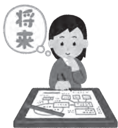
見通しのある堅実な財政運営を

企画財政部長 現在借り入れしている市債の大半は、臨時財政対策債と同様に後年度に元利償還分の一部が交付税に算入される有利なもの。財政硬直化の判断指標である経常収支比率は、平成30年度決算において県内10市で一番低く、将来負担比率も発生していない良好な財政状況です。