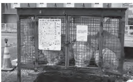
ごみを減らして循環型社会へ転換を