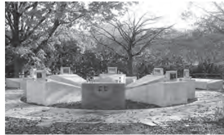
県内初の市営合葬墓～弘前市～

議員 教育委員会の委員から「特別支援教育支援員の増員が必要ではないか」という意見が出ていますが、2名の増員だけでは十分な対応ができないのでは。 教育部長 特別な支援を必要とする児童生徒を支援する者の数は、学校からの要望を精査し、総合的に勘案して2名の増員としており、適正な配置と考えています。