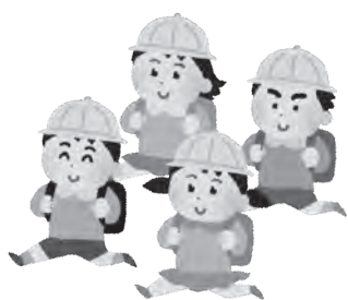
子供を事故から守ろう

議員 いじめや暴力を防止するために、小学校の全教室に「こども六法」の本を配置する考えは。