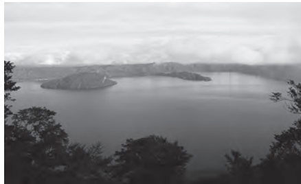
資金集めの過程で観光の意識づくりを

がある一方で、多くの人の共感を得なければ資金を集められない難しさもあります。今後は十和田奥入瀬観光機構と連携し、活用の可能性を探っていきたいと考えています。