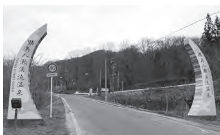
焼山地区に魅力的な町並みを

総務部長 策定作業中の行政改革大綱の取組の中で、現在の紙媒体中心の文書管理の仕組みを見直し、電子決裁システムの導入も含めて検討を進めます。