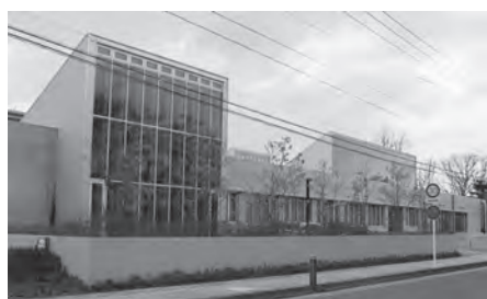
若駒学習室がある教育研修センター

教育部長 通室者一人 一人と面接相談を行い、 現状の改善や学校復帰 に向けた適応指導を 行っています。指導内 容は、5教科中心の学 習のほか、調理実習や 制作活動、カードゲー ム等を使った交流活動 も取り入れています。