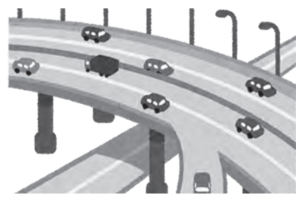
高規格道路の整備で地域の活性化を