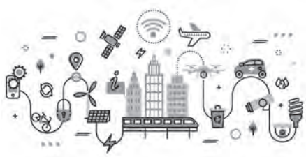
ICT活用でスマートシティの取組推進を

企業財政部長 中央病院へのAI問診導入、指定緊急避難場所等の位置情報のオープンデータ化等に取り組んでおり、今後も調査研究と当市の地域特性に応じた活用策を検討したいと考えています。