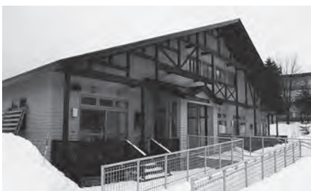
地域の力で再出発した十和田湖保育園