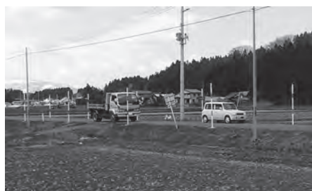
赤沼地区に設置された視野対策ポール

建設部長 昨年11月下 旬に設置し、3か月が 経過しましたが、今の ところ事故は発生して いません。