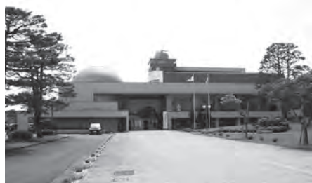
指定管理者へ非常時対応の指導徹底を

議員 マニュアル対応を指導しています。が、不十分な点もあり、早急に体制を整えます。