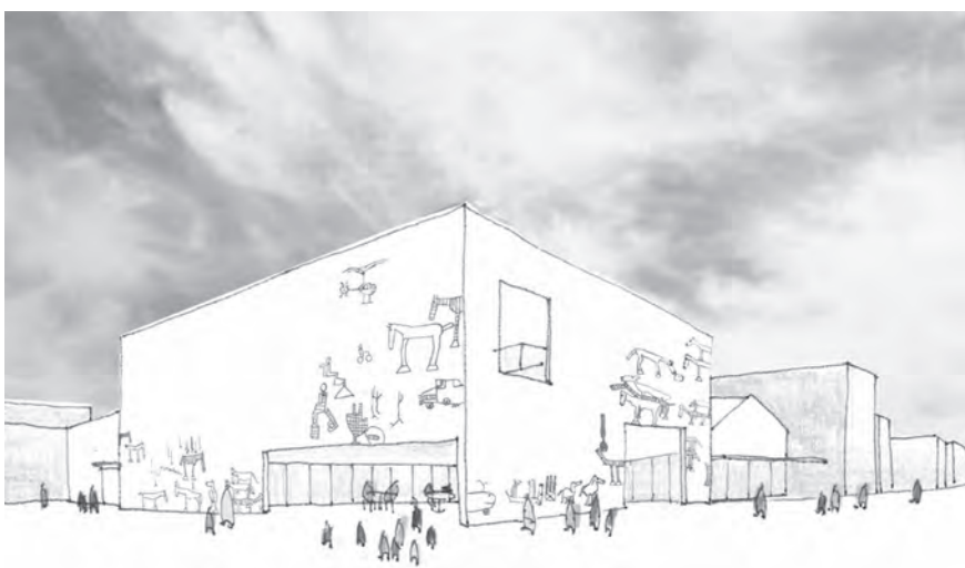
(仮称) 地域交流センターイメージ図