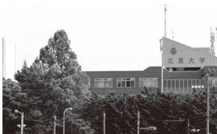
夏期休業の大幅な短縮を検討中の北里大学