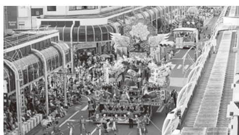
代替イベントでにぎわいを取り戻そう