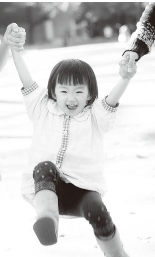
まちの笑顔を守り抜こう

⑱市の経済状況等を考慮し、令和2年12月に支給される市長の期末手当を2分の1に引き下げ（議案第41号）