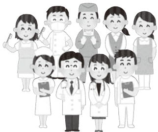
命がけで働く医療従事者に相応の待遇を

農林商工部長 熊の生熊に詳しいNPO法人日本ツキノワグマ研究所に助言を求め、熊の習性や市街地の構造を考慮し、一定期間内に目撃情報がなかったことから、警戒態勢を解除し、これを駒らん情報メールで周知しました。