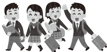
県内や隣県からの遠足や修学旅行の誘致を

企画財政部長 市の移住支援制度を利用した移住者数は、平成29年度は45世帯117人、平成30年度は38世帯94人、令和元年度は46世帯125人と増加傾向が見られ、3年間の合