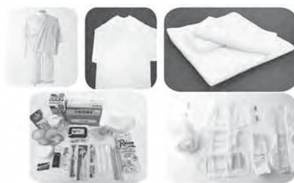
中央病院で利用できる入院セット

病院事務局長 セット内容や料金等の確認ができるよう、写真を含めて病院ホームページへ速やかに掲載したいと考えています。