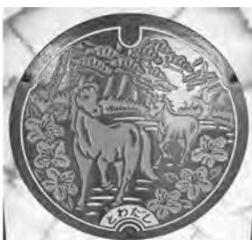
当市もカードを発行しているマンホール蓋