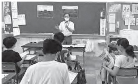
昨年7月に北園小学校で開催された出前講座

議員 町内会への加入促進の考え方は。 民生部長 会員確保の相談等に応じながら、関係団体と連携した働きかけや、広報等での加入の啓発を図っていき