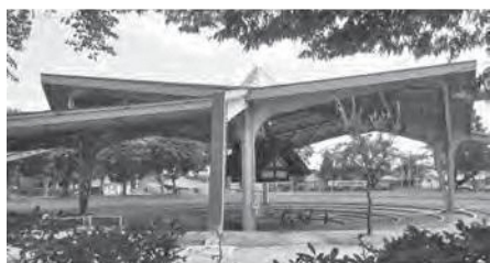
上屋根が撤去される前の相撲場

を活用するため、あお もり国民スポーツ大会 の開催に必要な規模で なければなりません。 屋根は撤去前と同程度 であれば、高校相撲等 の各大会の対応は十分 可能と相撲関係者から 意見を頂いています。 また、他自治体の相撲 場と比べても遜色のな い大きさだと考えてい ます。