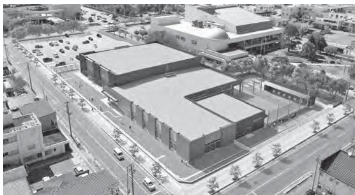
志道館の完成予想イメージ

令和3年第4回定例会は、11月30日から16日間の会期で開かれました。十和田市国民健康保険税条例の一部を改正する条例の制定など、議案29件(発議3件含む)、報告4件、認定1件が上程され、発議1件が否決、その他は原案のとおり可決されました。 令和3年第2回臨時会は、12月27日に開かれました。十和田市観光物産交流施設の指定管理者の指定をはじめ、議案3件が上程され、原案のとおり可決されました。