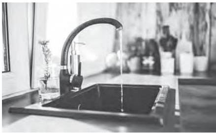
住民生活や社会経済活動を支える水道事業

住民生活や社会経済活 動を支える重要なイン フラであり、民営化に より公共性や継続性、 料金の高騰、水質低下 さらには災害時の対応 など、サービスの低下 や安定供給への影響が 懸念されるため、民営 化は考えていません。