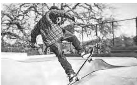
整備が望まれるスケートボードパーク