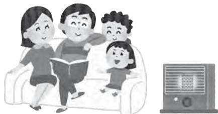
冬を暖かく過ごすために福祉灯油の支援を

健康福祉部長 灯油価格の推移を注視し、国の経済対策等を踏まえ、必要に応じて今後検討していきたいと考えています。