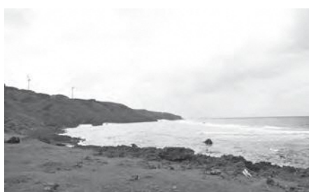
環境保全と事業の調和のための条例検討を

国や県が進めるエネルギー政策の取組を踏まえて調査研究していきたいと考えています。