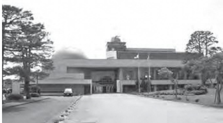
施設の有効活用のためにも申請期限の短縮を

健康福祉部長 広報に手話紹介コーナーの開設、講座の実施、市の記者会見への導入など、手話を目にする機会を増やす取組により、市民の手話や聴覚障害者