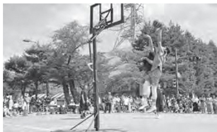
一昨年のまるっとフェスでも好評だった3×3

議員 天候や季節に関係なく、いつでも快適に利用できる全天候型の遊戯施設が当市にも必要だと思いが、市の見解は。 企画財政部長 第2次総合計画後期基本計画策定の市民アンケートでも、今後市に設置を望む施設として「子ども・子育てのための施設」が一番多く選択されています。子供のための取組は人口減少対策の重要な施策です。整備の必要性も含め、今後調査、研究したいと考えています。