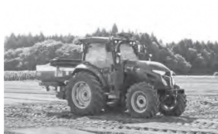
高額な農業用機械の導入に補助を

現在は認定新規就農者や新規認定農業者を対象に支援を継続し、課題である農業経営体の確保に努めています。また、国でも支援を実施しているため、機会