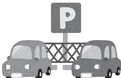
路上駐車対策のため公園に駐車場の整備を

一方、駐輪スペースは特段設けていませんが、公園内の支障のない場所に止めて、利用いただいています。