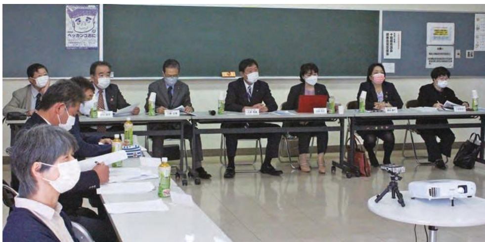
十和田地区保育研究会と意見を交わす 民生福祉常任委員

保育現場の現状や課題、問題提起を考慮する機会、そして、子供を守り、育てるといふ思いで今後もできることから着実に取り組んでいくことを再確認する機会となりました。