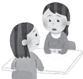
悩みや不安を抱え込まずに相談を

健康福祉部長 保健師または中央病院メンタルヘルス科医師によるこころの相談を保健センターにて来所や電話で受け付けています。