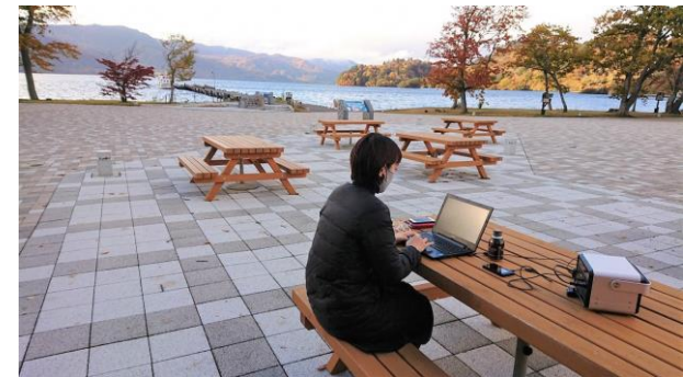
十和田奥入瀬誘客・ワーケーション推進協議会が実施したワーケーションモニターツアーの様子（令和2年10月）