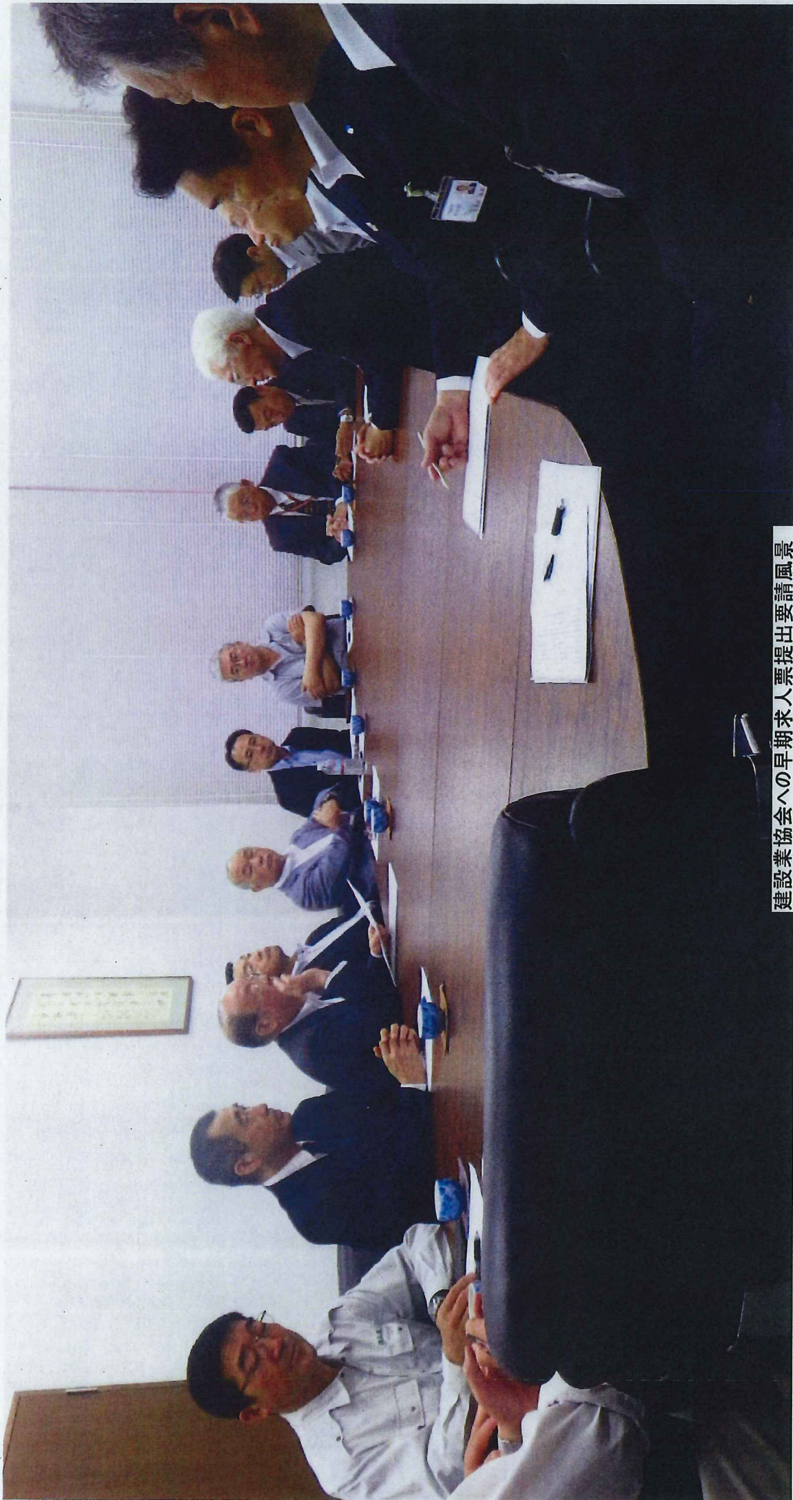
建設業協会への早期求人票提出要請風景