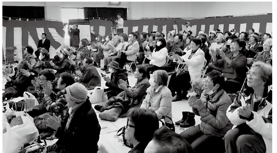
▲ 昨年の演芸会から ▲