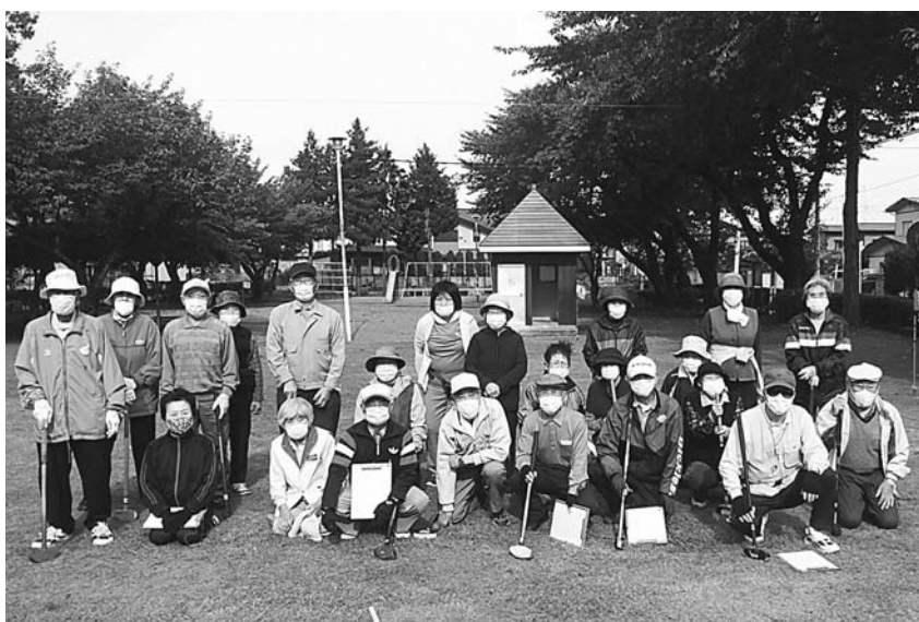
町内グラウンドゴルフ大会