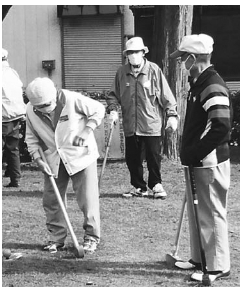
町内グラウンドゴルフ大会