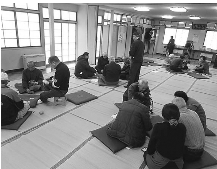
新年会・トランプ大会