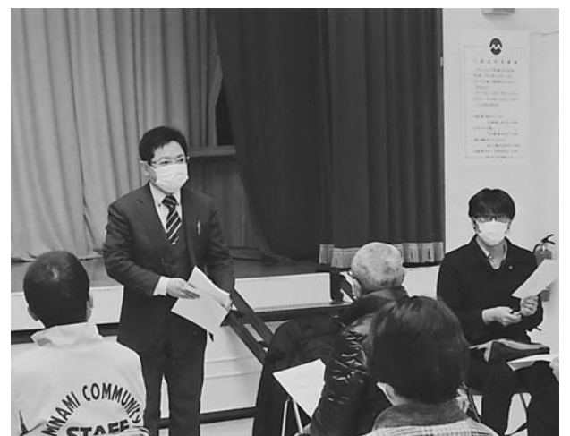
南小教頭先生のあいさつ