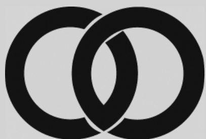
コミュニティシンボルマーク