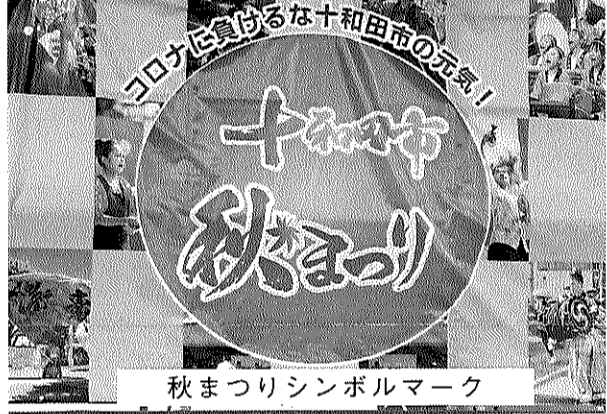
秋まつりシンボルマーク