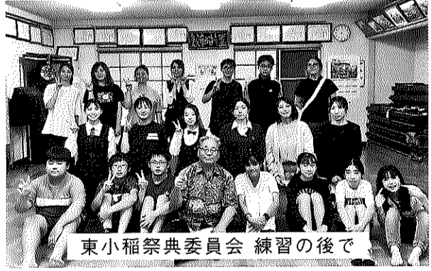
東小稲祭典委員会 練習の後で