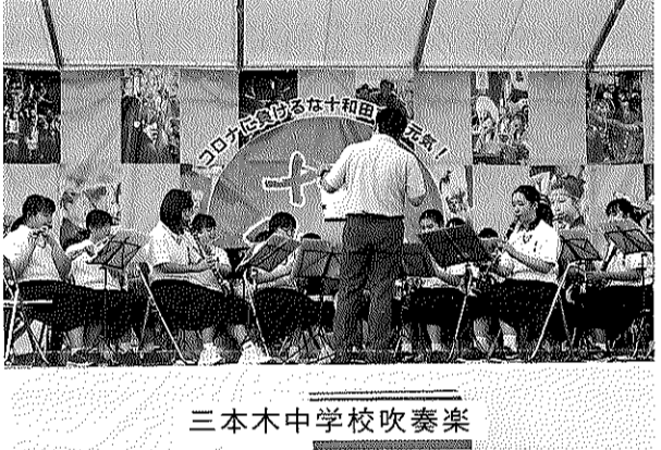
三本木中学校吹奏楽