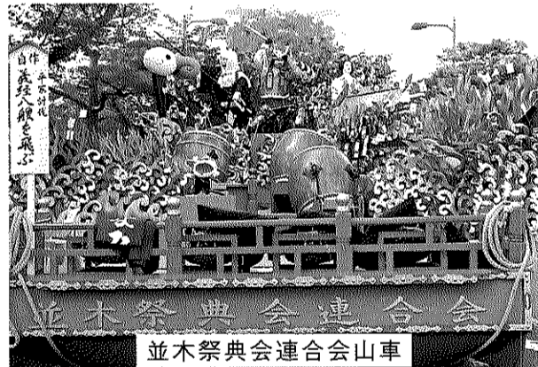
並木祭典会連合会山車