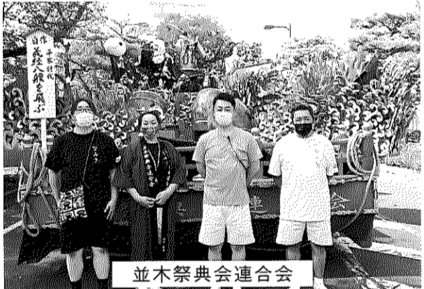
並木祭典会連合会