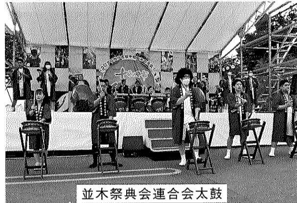
並木祭典会連合会太鼓