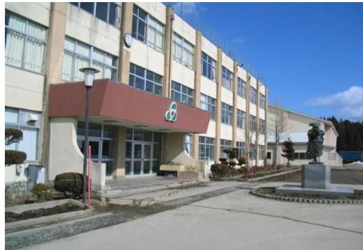
大深内中学校 現況