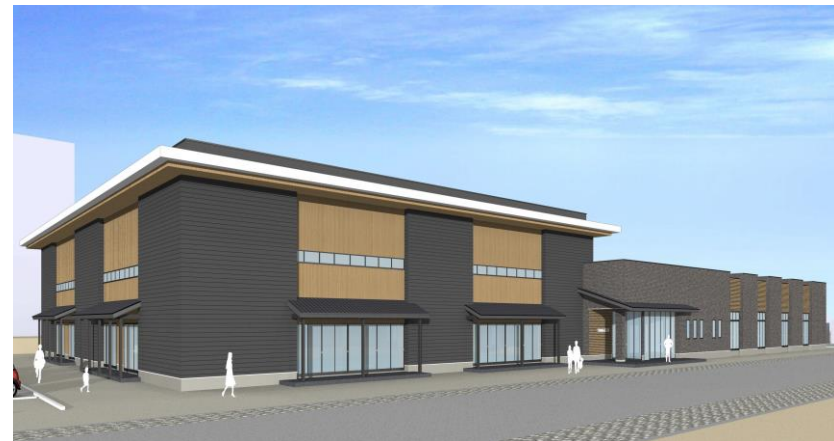
(新) 志道館イメージ図