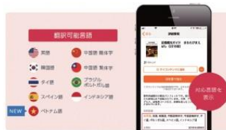
多言語配信できる (英語・中国語繁体字・中国語簡体字・韓国語など) ※