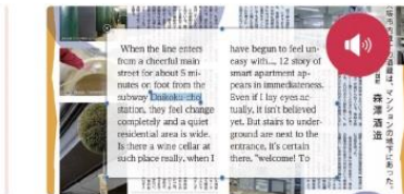
ポップアップ機能でスマホ端末でも読みやすい 多言語で読み上げ機能がある (スピード調整可) ※