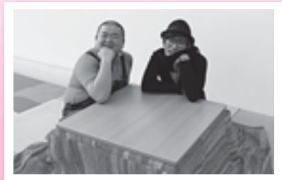
▲こたつのように十和田の人からは温かなぬくもりを感じますとうれしそうに話す

生の“お笑い”に触れて いっぱい笑って元気になってほしい 笑いのための努力は惜しみません！