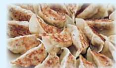
十和田 おいらせ餃子