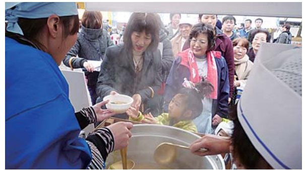
▲好評のひめます汁の無料振る舞い

十和田湖げんき隊では、会場で実施したアンケートをもとに、今後の商品化や十和田湖の活性化に向けた検討を進めることとしています。