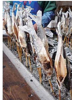
▲▶ひめますを使ったさまざまな料理が並びました