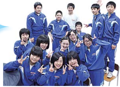
Shiwa junior high school