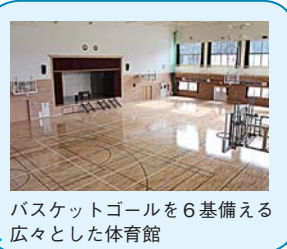
バスケットゴールを6基備える広々とした体育館