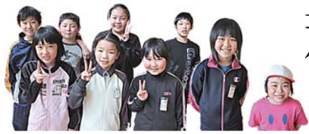
Shiwa elementary school