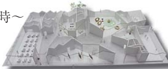
▲ (仮称) 市民交流プラザ模型写真