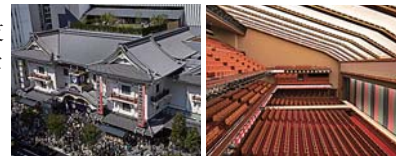
本年 4 月に開場した「歌舞伎座」

最近では、歌舞伎座、浅草文化観光センター、長岡シテイホール「アオーレ」などを手掛ける。