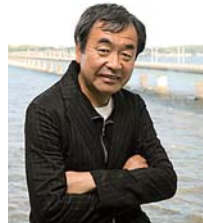
建築家 隈 研吾さん

1954 年横浜生まれ。1979 年東京大学建築学科大学院修了。コロンビア大学客員研究員を経て、2001 年より慶應義塾大学教授。2009 年より東京大学教授。