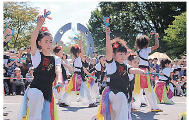
元気溢れる踊りを披露した皆さん

9月29日、官庁街通りと中央公園緑地を会場に「2013 とわだ Yosakoi 夢まつり」が開催されました。見事な青空が広がる秋晴れのもと、県内はもとより、岩手県、秋田県から参加した全27チームが趣向を凝らした衣装に身を包み、元気溢れる踊りを披露しました。両会場とも多くの観客が訪れ、ときには演舞者と観客が一緒に手拍子をたたくなど一体となってヨサコイを楽しみ、各チームが踊り終わると大きな拍手が送られていました。