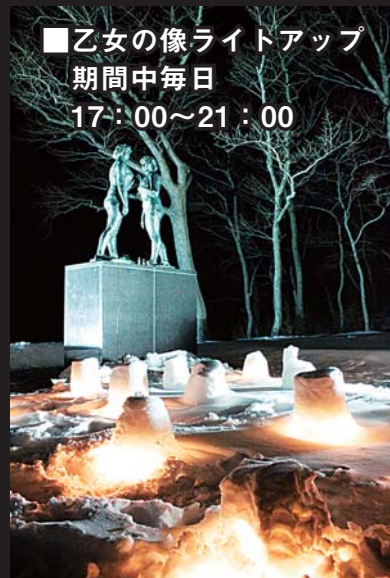
■乙女の像ライトアップ 期間中毎日 17:00~21:00