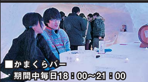
■かまくらバー 期間中毎日18:00~21:00