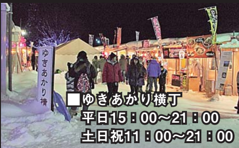
■ゆきあかり横丁 平日15:00~21:00 土日祝11:00~21:00