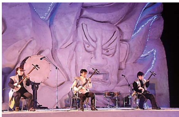
メイン雪像のステージでは津軽三味線ライブや郷土太鼓の演奏などが行われました

2月7日、十和田湖畔休屋特設イベント会場で、北東北最大級の雪祭り「十和田湖冬物語」が開幕しました。会期は3月2日まで。「ねぶたと竿灯」がテーマのメイン雪像や青森・秋田両県の郷土料理が味わえる「ゆきあかり横丁」、カクテルやお酒を堪能できる「かまくらBar」や「酒かま蔵」が設置されています。また、期間中毎日午後8時から花火が打ち上げられ、冬の十和田湖を美しく彩っています。