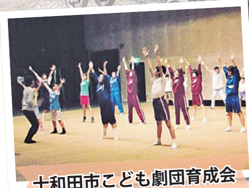
十和田市子ども劇団育成会

カメラ好き女子たちが撮影したゆるくてふわっとかわいらしい仕上がりの十和田の写真。メンバーが撮影した写真はインターネットでの発信のほか、ポストカードにして、市内を訪れた観光客に配布し、十和田を県内外にPRします。