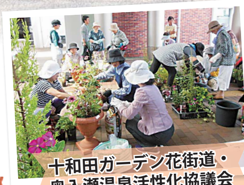
十和田ガーデン花街道・ 奥入瀬温泉活性化協議会

かごは、斜め編みや、ピンクと白などこれまでにないカラーリングが特徴で、試作品づくりに励んでいます。今後インターネットでの販売を目指しています。