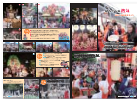
▲広報写真(組み写真の部)入選 2013年10月1日号 秋まつり