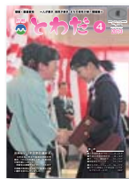
▲広報写真(一枚写真の部)奨励賞 2013年4月1日号 表紙