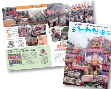
▲広報紙の部(総合)市の部入選 2013年10月1日号

9月に開催された「北海道・東北B-1 グランプリ in 十和田」や「十和田市秋まつり」を中心に掲載しました