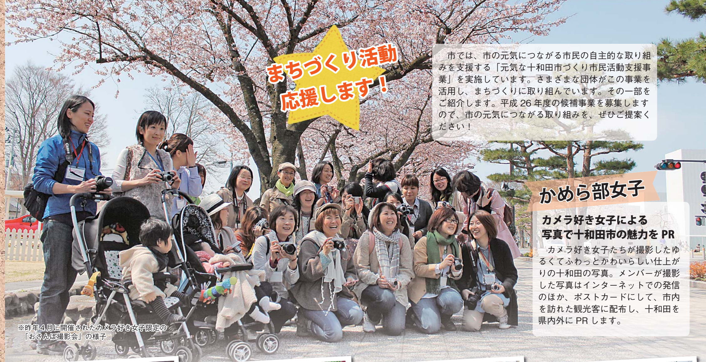
※昨年4月に開催されたカメラ好き女子限定の「おさんぽ撮影会」の様子

市では、市の元気につながる市民の自主的な取り組みを支援する「元気な十和田市づくり市民活動支援事業」を実施しています。さまざまな団体がこの事業を活用し、まちづくりに取り組んでいます。その一部をご紹介します。平成 26 年度の候補事業を募集しますので、市の元気につながる取り組みを、ぜひご提案ください！