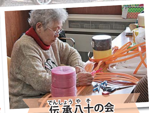
でんしょうや 伝承八十の会