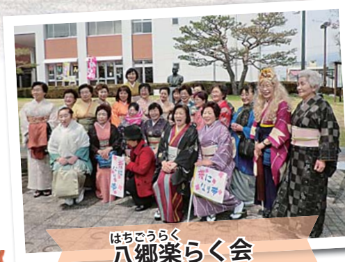
はちろうらく 八郷楽らく会

十和田ガーデン花街道は、花の専門知識を生かして、官庁街通りに植えられた宿根草の手入れや、活動に参加する市民ボランティアの育成のため、寄せ植え教室を行いました。また、奥入瀬温泉活性化協議会では、焼山地区の環境美化のため、ハンギングバスケット講習会を行い、地域に花を飾り、美しい沿道景観づくりに取り組みました。