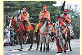
平成22年に実施した「古代馬絵巻」の様子

馬の文化と開拓精神を郷土の誇りとして市民が実感できるように、駒街道を馬が駆け抜ける市民参加型のイベントを行います。