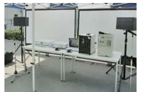
▲放送機器などの備品が整備されました