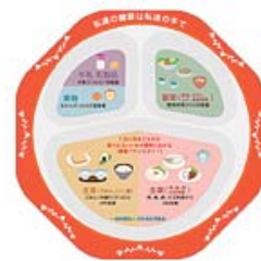
▲バランスプレート