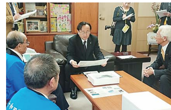
三村県知事に登録の喜びを報告。知事も「登録はうれしいこと、販路の拡大につなげたいですね」と話しました