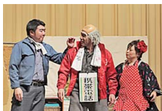
昨年行われた「じゅんちゃん一座」による寸劇の様子