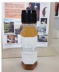
▲十和田のごぼうたっぷりドレッシング

十和田産のごぼうを100%使用していることから「十和田のごぼうたっぷりドレッシング」と命名。化学調味料を不使用かつ常温保存タイプのため、安全・安心で手軽に料理に取り入れることができます。