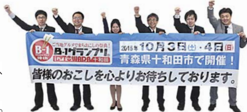
大会まであと7カ月。`ガッツポーズ。で意気込みを見せる実行委員会事務局の皆さん