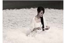
Cut Papers #14

会期中毎日行われます。雪景色を連想させる空間にハサミで紙を切り続ける音が響きます。