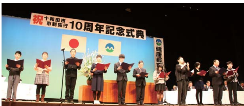
市民を代表し、宣言文を読み上げました

宣言文には、本市の健康づくりの指針として平成25年3月に策定した「十和田市健康づくり基本計画（第2次健康とわだ21）」に沿い、市民が取り組む5領域（▽身体活動▽栄養▽健康診断▽睡眠・休養▽こころ）を取り入れています。市では、10周年を機に、市