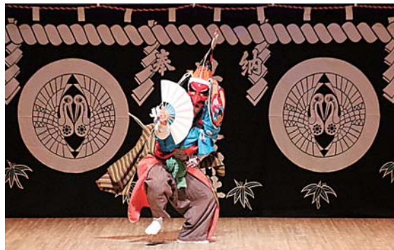
早池峰岳神楽保存会による「天孫降臨の舞」。迫力ある演舞を披露し、観客を魅了

伝統芸能の歴史と文化の継承を目的に、市民文化センターで「第25回十和田市伝統芸能まつり」が開催されました。南部駒踊立崎保存会や大不動鶏舞保存会など市内7団体の他、ユネスコ無形文化遺産に登録され、国の重要無形民俗文化財の早池峰岳神楽保存会（岩手県花巻市）が招待されました。各団体は地域で受け継がれている伝統芸能を披露し、会場から大きな拍手が送られました。