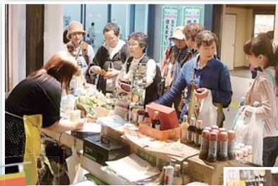
◀新幹線の待ち時間などにお土産品を探す観光客でにぎわいます