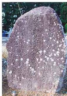
相坂上共同墓地の石碑

銘文 天下和順天明六九州筑後国久留米早 奉納大乘妙典六十部日本回国 日月清明七月吉祥日願主新六母艸心 寛政二庚戌九月初九日病死