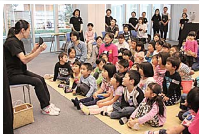
20周年記念お話し会の様子

な「語り」を披露しますが、重きを置くのは、絵などを見せずに静かに語る『ストーリーテリング』。「耳で聞くお話しから想像の翼を広げてほしい。そして、自ら本を手に取り、本を友にできるよう、お手伝いできれば」と、会員の皆さんが思いを込めます。 毎月第2・4土曜日に市民図書館で行うお話し会の名は「おなはしのゆうびんやさん」。会員が手を携えて届け続ける読書の種。子どもたちを育む、じっくりとしなやかな活動はこれからも続きます。