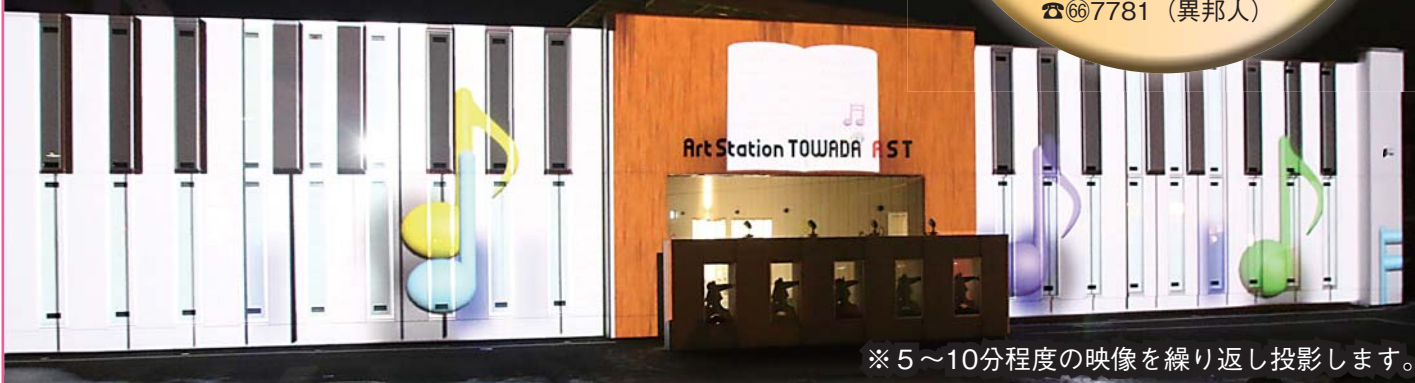
※5～10分程度の映像を繰り返し投影します。