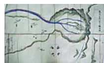
滝沢八左エ門知行山絵図面