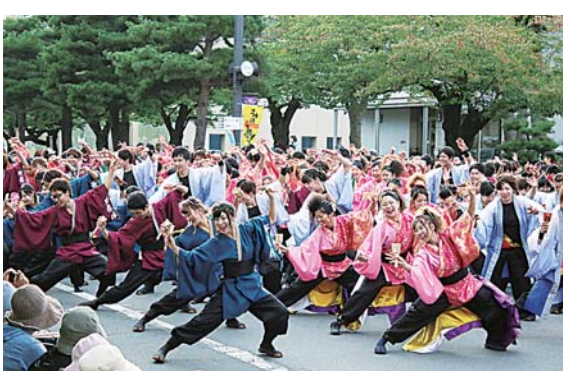
全チームで『よっちょれ』を踊り、フィナーレを迎えました