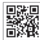
◀QRコードを読み取り空メール送信