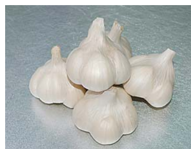
白く輝く十和田産ニンニク