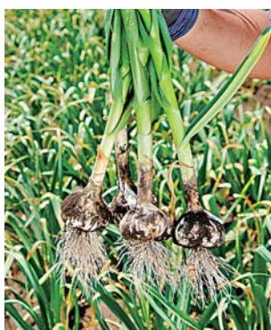
茎や根を切っていない状態のニンニク