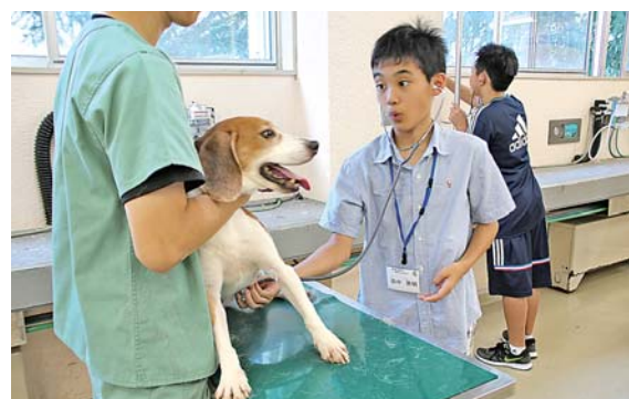
犬の心音を聴診器で聞く参加者