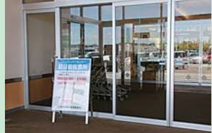
イオンスーパーセンター十和田店