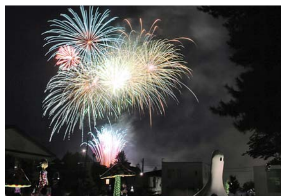
アート広場から見る花火は十和田市ならではの光景です

市陸上競技場などで「第59回十和田市夏まつり花火大会」が開催されました。市街地で行われる花火大会としては県内最大級を誇る本市の花火大会。午後7時から約4,000発の花火が打ち上がり、夜空に映し出された色とりどりの光の競演に観客からは大きな歓声が上がりました。この日は、天候にも恵まれ、一部が歩行者天国となった官庁街通りなどに多くの家族連れや浴衣姿の若者が繰り出し、にぎわいを見せました。