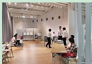
市民交流プラザ「タワーレ」

平成28年7月10日の参議院議員選挙から2カ所（市民交流プラザ「タワーレ」とイオンスーパーセンター十和田店）の期日前投票所を増やしました。