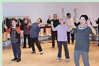
今年4月15日から始まった「Towerleいきいき交流会」の様子

中心商店街に高齢者が気軽に参加できる集いの場を設け、介護予防に関する知識の普及や体力づくり、介護相談に応じるため、市民交流プラザ「タワーレ」で「Towerleいきいき交流会」（毎週金曜日開催）をスタートさせました。