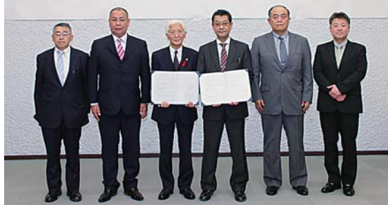
小山田市長と同支部の皆さん。同支部が同協定を締結するのは八戸市に次いで2例目です