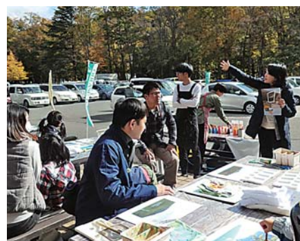
焼山アートプロジェクトでの活動

今年、商店街の一角を利用して、現代美術館と商店街を結び、アートを地域に発信する拠点をつくる予定です。他の地域でも、山形では、まちを楽しくしようと、古い建物をリニューアルして「とんがりビル」を造り、秋田では、地域・個人・共同をコンセプトにした「ココラボラト