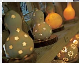
ランプの明かりは周りを温かく包みます