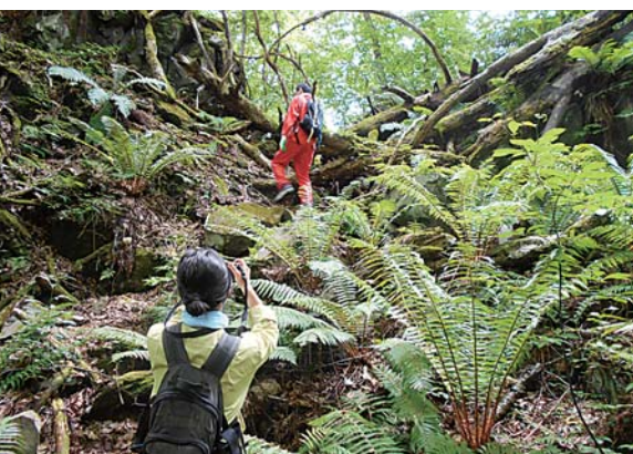
「自籠岩」への道 名所調査

十和田湖に夢中な人、夢中になった人が新たな魅力を発見し、それをまた教えていく、そんなこの地域の魅力をテーマに、お互いが研究者にも先生にも学生にもなれる学校のような環境ができればと考えています。