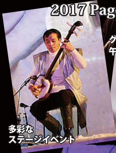
多彩な ステージイベント

平日 午後3時～9時 土日祝 午前11時～午後9時 問十和田湖冬物語実行委員会 ☎2425