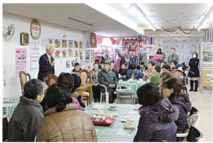
街なか市場で市長と語る会の会

今後とも、市民と行政のパートナーシップのもと、これからのまちづくりについて全力で取り組んでまいりますので、より一層のご理解とご協力をお願い申し上げます。