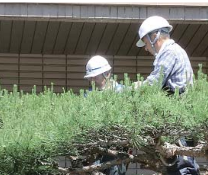
まだまだ現役で活躍中

健康な高齢者は年々増加傾向にあり、65歳以上の高齢者の多くが、現役で活躍し、地域の活性化に貢献しています。そのため、従来の「高齢者」観は、高齢者の実態とそぐわなくなってきたおり、今後、多くの高齢者がよりいっそう元気に、さまざまな場面で活躍できる社会が創出されると予想されます。