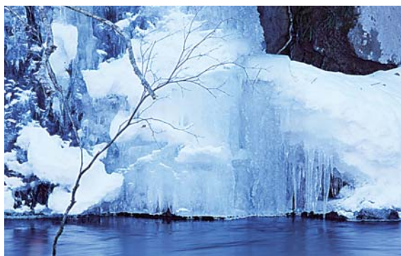
奥入瀬溪流の冬景色