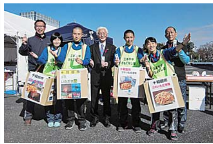
B-1 グランプリスペシャル in 東京・臨海副都心