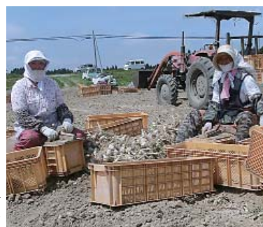
楽しい農作業のひとつ