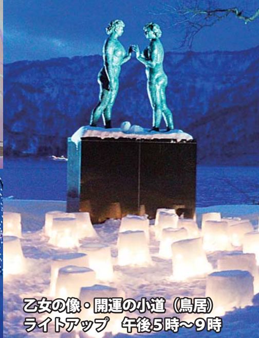
乙女の像・開運の小道(鳥居) ライトアップ 午後5時～9時