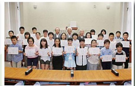
十和田市子ども議会