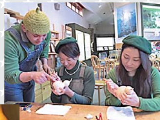
製作したランプは持ち帰りできます

申問 政策財政課地方創生・婚活支援係 ☎⑤16712 NPO法人プラットフォームあおもり ☎017-763-5522