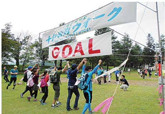
十和田湖ウォーク

十和田湖で知ったことはなるべくそのままにしないように、フェイスブックを通じた情報発信を行っています。また、観光客が十和田湖での次の予定を見つけれられるように閲覧資料「十和田湖図鑑」を作成しています。こちらは第1弾として湖畔休屋の飲食店をまとめ、10月に休屋地区内の観光拠点に設置しました。