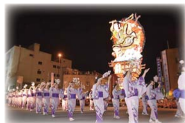
▲昨年、五所川原市で開催された10市大祭典の様子（五所川原立佞武多と三本木小唄）