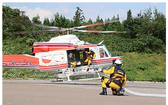
防災ヘリコプター「しらかみ」に給水装置を装着するため、ヘリの着陸を待つ青森県防災航空隊員

高森山総合運動公園（深持字梅家ノ下）を会場に青森県防災航空隊との連携による林野火災対応訓練が開催されました。十和田地域広域事務組合消防本部（39人）、十和田市消防団（第3分団20人）、および青森県防災航空隊（9人）が合同で訓練を実施することで、相互の関係強化を図るとともに、的確な指揮命令系統ならびに消防活動体制の構築を確立し、参加隊員の技術と知識の向上を図ることができました。