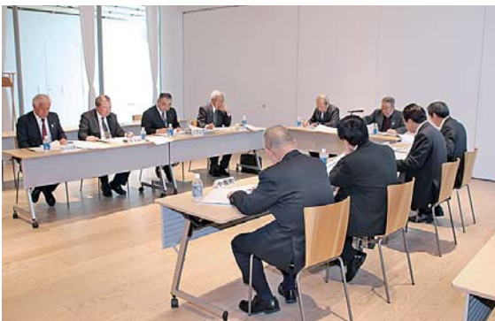
圏域の10市町村の首長らが一堂に会しました