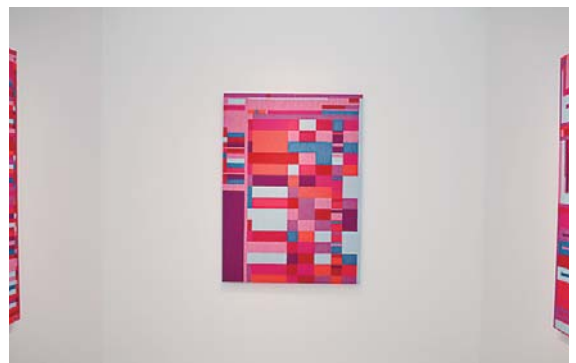
新作のタペストリー作品

同企画展は公的な美術館で行う初めての個展で、16パターンの大型映像作品、タペストリー作品、言葉の芸術「俳句」、鑑賞者がカーソルを動かして作品の動きを楽しめる映像などでその世界観を表現しています。