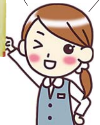
平成30年度版 「家庭ごみの出し方、 収集日程表」

広報とわだ3月号と一緒に配布しました。届いてない人は、ご連絡下さい。市のホームページでもご覧いただけます。